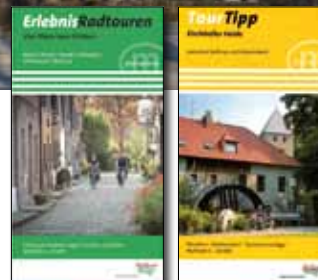
ErlebnisRadtouren „Vier Flüsse zum Erleben“ und TourTipp „Kirchheller Heide“ Zu beziehen im Buchhandel oder im Online Shop des RVR.